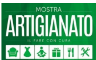
Il logo della mostra mercato

La Mostra Mercato dell'Artigianato, tradizionale appuntamento autunnale che si svolge a Lariofiere di Erba da oltre quarant'anni, ripropone agli artigiani la possibilità di presentare i propri prodotti agli oltre 40 mila visitatori che, anche nell'edizione passata, hanno assiepato i corridoi di Lariofiere. La 43ª edizione si terrà dal 29 ottobre al 6 novembre prossimi. Le imprese interessate ad esporre alla Mostra dell'Artigianato, che ci invieranno la loro adesione entro il 15 giugno, potranno usufruire di un