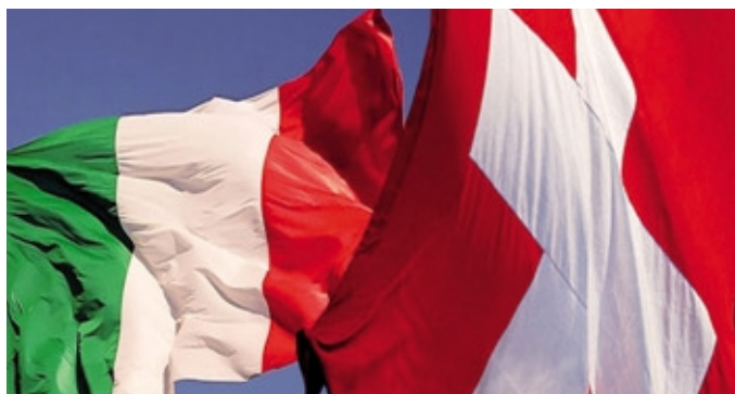
Mercoledì 18 maggio si è riunito il Tavolo di lavoro economia

Si è riunito mercoledì 18 maggio scorso, il Tavolo di lavoro economia dedicato alla LIA (Legge Imprese Artigianali), con lo scopo di seguire con attenzione prioritaria il tema della LIA e monitorare l'entrata in vigore, la prima applicazione e le possibili implicazioni di questa legge sul territorio della Regio. All'incontro, erano presenti fra gli altri, anche i rappresentanti di Confartigianato Imprese di Como e di altre province di confine del sistema associativo Lombardo. I rappresentanti della Commis-